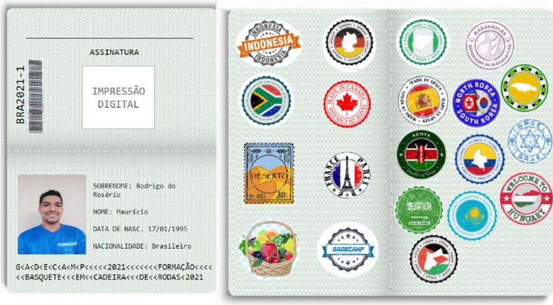
Figura 1. Projeto passaporte

*Cada carimbo refere-se aos países já visitados e registro de participação.